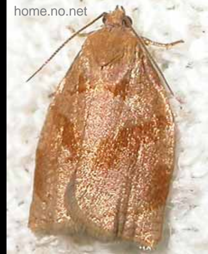
A lepke, amit a csapda fog

Kárképe: a kis hernyó a rügyekben károsít, azok torzán fakadnak, a levelek összesodrottak. Virágzaskor a hernyó a termőrészekkel táplálkozik, a szirmokat összeszövi, így azok nem bomlanak ki, hanem megbarnulnak. Később a leveleket tölcsérszerű szivarrá szövi össze.