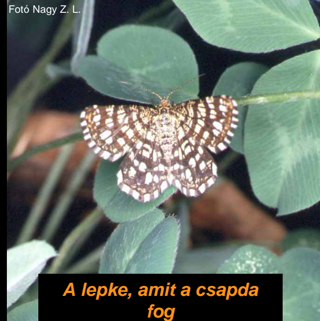
A lepke, amit a csapda fog

A feromoncsapdát 0,5-1 m magasan, ill. a lucerna felső szintjének magasságába tegyük ki. A csapdázás megkezdésének szokásos időpontja április eleje.