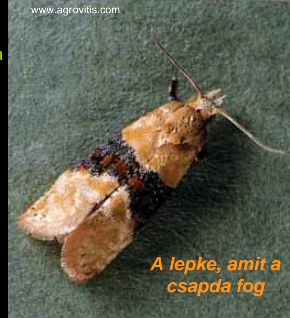
A lepke, amit a csapda fog

A CSALOMON® csapda szelektivitása: er-dőszéli bokros közelében esetenként fog-hat nagyobb mennyiségben Cnephasia fa-jokat, elsősorban C. eculliana -t, amely a nyerges szőlőmólnál valamivel kisebb és elülső szárnya egyszínű feketésszürke.