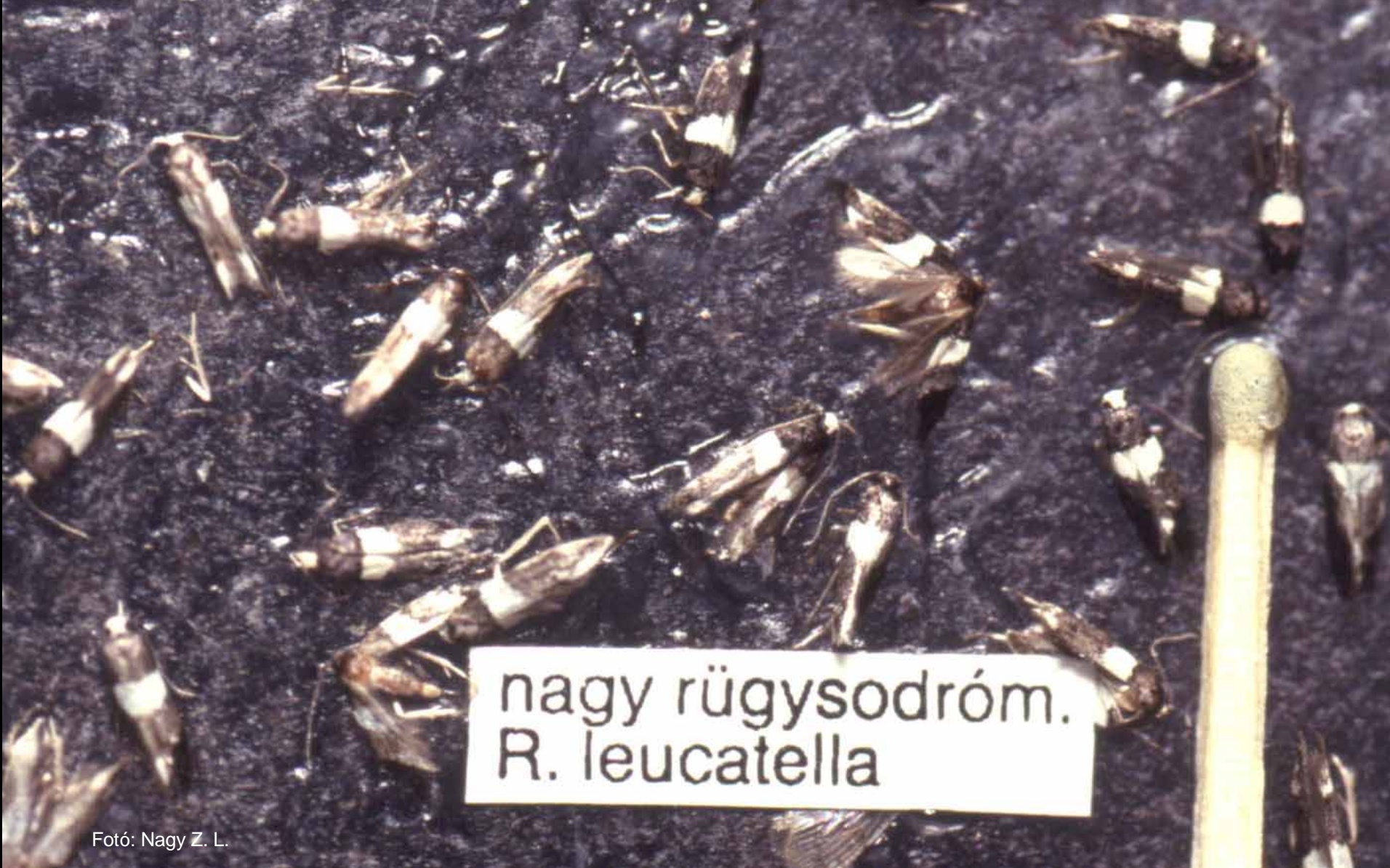
nagy rügysodróm. R. leucatella