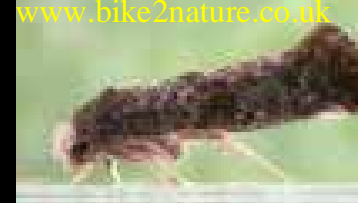
A lepke, amit a csapda fog

Az almalevél-tarkamoly kártevőként van számon tartva Európában, É-Afrikában és Japánban. Hazánkban, bár mindenütt jelen van, csak potenciális kártevőnek számít. Feromoncsapdáinkkal észlelhetjük a kártevő jelenlétét, tömeges fogás esetén felkészülhetünk a szükséges védekezésre.