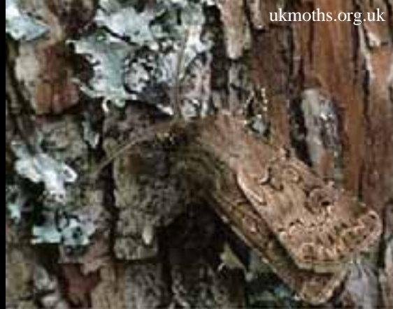
A lepke, amit a csapda fog

A CSALOMON® csapda szelektivitása: a csapdába az fésűs földibaglyon kívül esetenként néhány példány a gamma bagolylepkéből ( Autographa gamma ) vagy a vetési bagolylepkéből is berepülhet. A gamma bagolynál a szárnyak sokkal sötétebb alapszínűek, és a jellegzetes "Y" jel jól látható. A vetési bagolylepkék kisebbek, keskenyebbek, és a csapfoltjuk kisebb, jelentéktelenebb. (Felhívjuk a figyelmet, hogy csapdavasztékunkban a gamma ill. vetési bagolylepkékre célzottan optimalizált, fajspecifikus csapdák is kaphatók!). Más lepkék csak véletlenszerűen repülnek a csapdába, s jól megkülönböztethetőek a fésűs földibagolytól kisebb termetük, ill. eltérő szárnymintázatuk alapján.