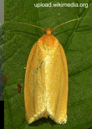
A lepke, amit a csapda fog