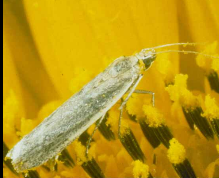
A lepke, amit a csapda fog

A feromoncsapdát a napraforgófejek magasságába - lehetőleg minél közelebb a fejhez - akasszuk. A csapdázás megkezdésének szokásos időpontja május eleje.