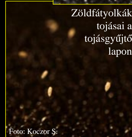
Zöldfátyolkák tojásai a tojásgyűjtő lapon